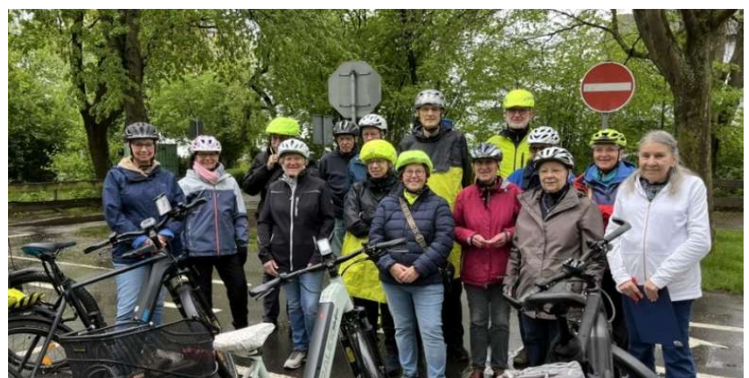
Zufriedene Gesichter beim Training im letzten Jahr.

Im letzten Jahr hatte der Seniorenbeirat Bad Vilbel wegen der zahlreichen Unfälle mit E-Bikes / Pedelecs, an denen Senioren beteiligt waren, zu einem speziellen Pedelec-Training für Senioren eingeladen. Wegen der Nachfrage wiederholen wir das Fahrsicherheitstraining in diesem Jahr.