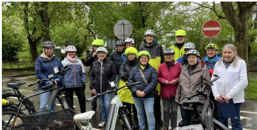
Zufriedene Gesichter beim Training im letzten Jahr.

Im letzten Jahr hatte der Seniorenbeirat Bad Vilbel wegen der zahlreichen Unfälle mit E-Bikes / Pedelecs, an denen Senioren beteiligt waren, zu einem speziellen Pedelec-Training für Senioren eingeladen. Wegen der Nachfrage wiederholen wir das Fahrsicherheitstraining in diesem Jahr. Am 17.04.2026 ab 10:00 Uhr findet auf dem Verkehrsübungsplatz in der Ritterstraße solch ein Training statt. Geleitet wird das Training wieder von Elfriede Pfannkuche.